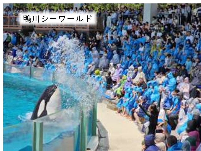
鴨川シーワールド

強盗致傷事件の被疑者逮捕 修学旅行出発日の朝、一週間前に五料地内で発生した事件の被疑者が逮捕されたというニュースが飛び込んできました。報道によれば、ベトナム国籍の20代男性2人が高崎市の宿泊施設で身柄を確保され、これまで県内西毛地域を拠点に生活していたとみられているとのこと。地元住民の間には犯行直後に高速道路を利用して逃亡したのではないかと憶測も流れていましたが、保護者による児童の送迎や本校職員による付き添いをしていた期間も、身近なところで凶器を所持したまま潜伏していたこととなります。児童に危害が加わることなく被疑者逮捕に至り、何よりでした。