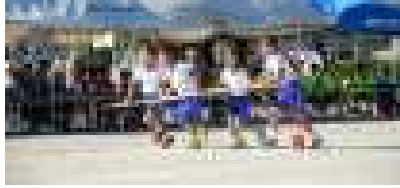
ぐるぐるサイクロン (3・4年)