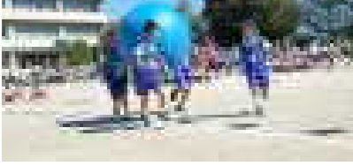
ファール昆虫レース (1・2年)