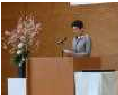
祝辞 茂木安中市長 様