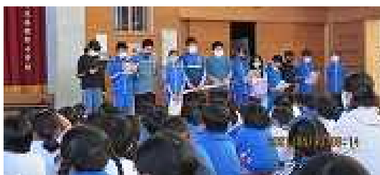
〈児童集会：本部役員が立派な態度で進行しています〉

8時20分から朝読書・朝学習・体育集会・児童集会・読み聞かせ等の活動を行います。感染症対策のため、現在は、全校での集会活動や読み聞かせの実施を見合わせています。 (裏面につづきます)