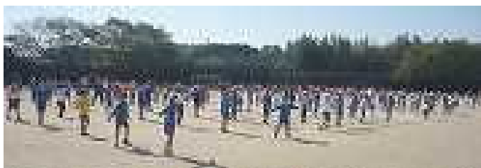
〈体育集会：先生のかげ声に合わせて運動しています〉

8時20分から朝読書・朝学習・体育集会・児童集会・読み聞かせ等の活動を行います。感染症対策のため、現在は、全校での集会活動や読み聞かせの実施を見合わせています。 (裏面につづきます)