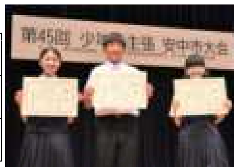
安中市少年の主張 出場者のテーマ