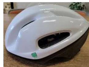
GR-1 (3,300 円)