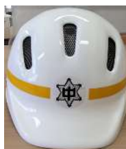
CR-2 (3,000 円)